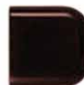
Brown creame 509

Structure âme du banc: Standard: 6 teintes au choix.