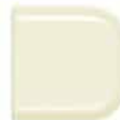
French Vanilla 501

Tapis standard: Dégradé 5 teintes. Sur demande: Motifs au choix.