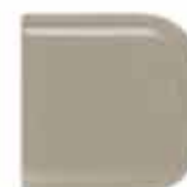
Gray Quartzite 513